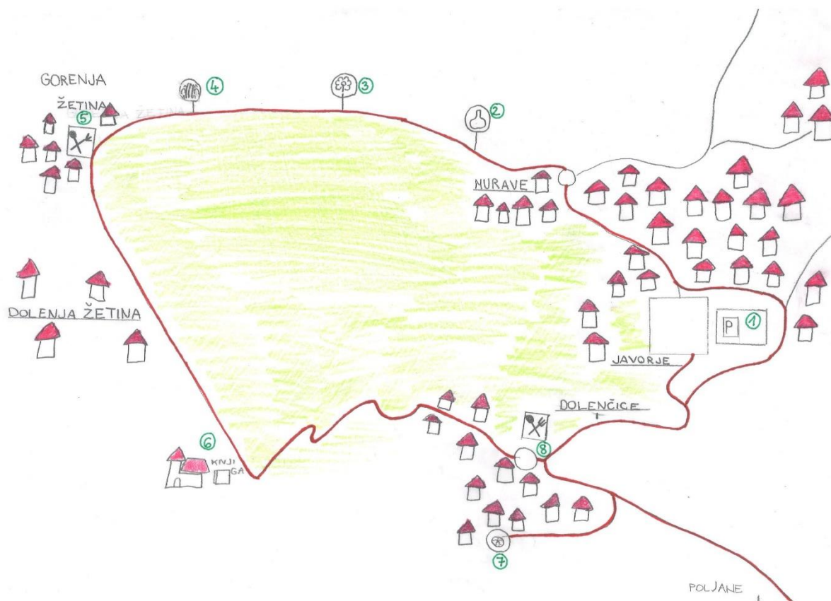
Slika 5: Zemljevid poti z označenimi točkami