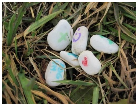
Slika 8: Kamenčki poguma