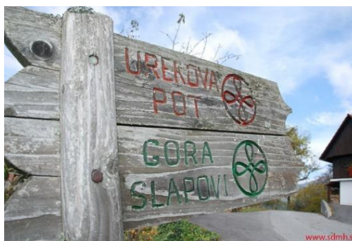
Slika 10: Oznaka poti