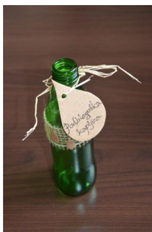
Slika 6: Steklenička čiste izvirske vode: Podblegoška kapljica

Ker nas je pot navkreber užejala si rečemo, da ni lepšega, kot odžejati in osvežiti se s čisto izvirsko vodo! Ob izviru vsak gost dobi tudi stekleničko v katero si bo natočil nekaj te bistre vode ter jo pospravil v svojo košarico.