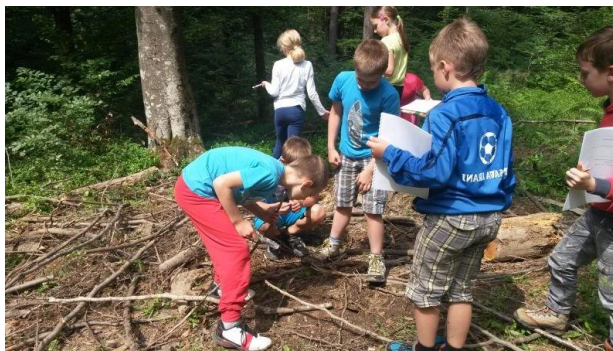
Slika 12: Ustvarjanje podob iz naravnega materiala

Vsak gost s kupčka potegne eno sličico in si jo dobro ogleda. Na njej so slike živali iz življenja v gozdu in na travniku, ter rastline značilne za ta kraj. Gostje dobijo nalogo, da na belo rjuho iz naravnih materialov (plodov, mahu, trave, odmrlih vej, iglic, kamnov, ...), ki jih najdejo v gozdu, ustvarijo podobe različnih živali in rastlin. Doživljamo in raziskujemo gozd.