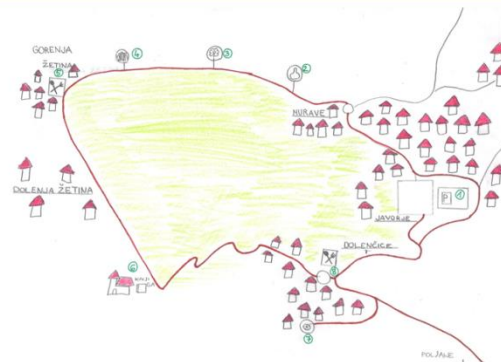
Slika 20: Reklamna zgibanka