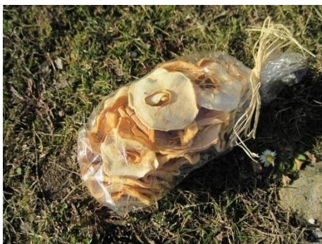
Slika 16: Vrečka suhega sadja

Gostje lahko Javorski hlebček na kmetiji tudi kupijo.