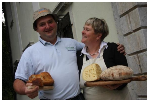
Slika 9: Gospodarja kmetije Pr' Andrejon s sirom Žetincem

Tako prispemo do kmetije odprtih vrat "Pr' Andrejon" , kjer si privoščimo okusno domačo malico, ki nam jo po velikanovem naročilu pripravi gospodinja Anka. Pri Andrejonovih se natančno vidi, kakšna je razlika med kmetijo odprtih vrat in kmečkim turizmom. Medtem ko malicamo njihove izdelke, se delo ne ustavi, mi kot gostje pa postanemo del kmečkega delovnega procesa. Ponujajo, kar imajo doma in tisto znajo pripraviti. Za nas pripravijo domačo malico: kruh, sir in klobaso. Bel kruh, je bil res bel in polnozrnat je bil res polnozrnat, čeprav se gospodar, ki pomaga pri strežbi pošali, da ne ve točno, kaj vse »vtaknejo« noter. Ob kruhu dobimo dve vrsti domačih sirov . Pravijo mu Žetinc – po kraju rojstva, čeprav priznajo, da ga delajo po tolminskih receptih. Eden je dimljen, drugi je tisti z velikimi luknjami. Ker so na tej kmetiji znani po pridelavi različnih odličnih vrst sira, nas gospodinja povabi, da si skupaj ogledamo kakšen je postopek pridelave. Preden se odpravimo, nam v spomin podari košček Žetince, ki ga shranimo v košarico k ostalim stvarim.