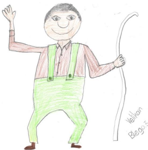
Slika 1: Idejna zasnova velikana Blegaša

Razmišljali smo, kako je velikan Blegaš izgledal in nastal je predlog (slika 1). Velikan je močan, visok mož. Ima velikansko glavo in nekaj las na njej. Oblečen je v zelene hlače in rdečo srnjco, obute ima rjave škornje, v rokah drži palico.