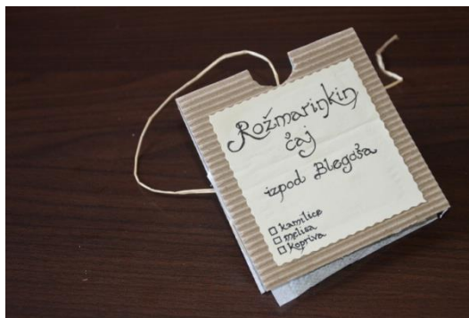
Slika 7: Rožmarinkin čaj

Skupaj z vilo se nato odpravimo iskat velikana. Hodimo in iščemo po obsežnih, s soncem obsijanih travnikih, dokler nekje daleč ne zaslišimo nenavadnega šumenja vode.