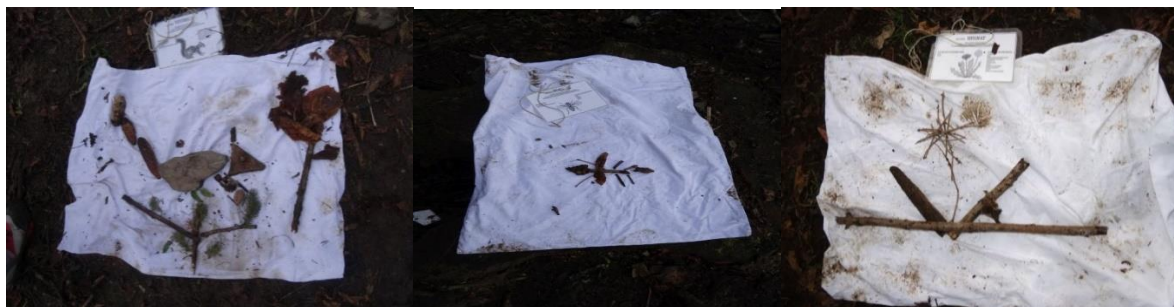
Slike 13, 14, 15: Živali iz naravnega materiala