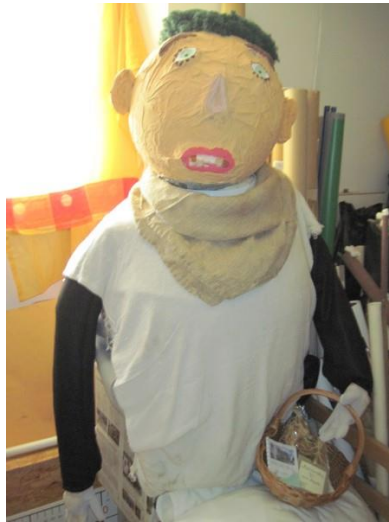
Slika 2: Maskota velikana Blegaša

rokah košaro z vsemi izdelki, ki jih bomo nabrali na naši poti. Velikan v podobni opravi nas bo tudi počakal ob poti in se nam na določeni točki, ki jo bomo opisali v nadaljevanju, predstavil ter nas popeljal naprej po njegovi poti.