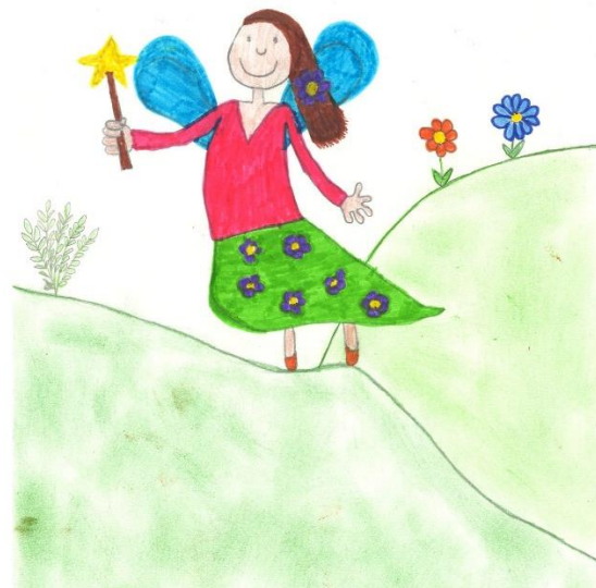
Slika 3, 4: Idejni zasnovi vile Rožmarinke

Narisali smo tudi zemljevid poti z označenimi točkami, ki bi jih prehodili skupaj z velikanom. Prikazan je na spodnji sliki.