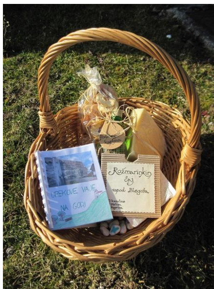
Slika 22: Košarica »velikanovih dobrot«

Vsako srečanje se običajno zaključi s prijaznim pozdravom in vabilom na ponovno snidenje. Ker smo si že ob začetku zamislili, da bi na naši poti nabirali uporabne, zdrave in predvsem unikatne izdelke iz naših krajev, smo se odločili, da bi košarica, ki bi jo vsak obiskovalec dobil ob začetku srečanja in bi se do konca srečanja napolnila, postala naš spominek na naše srečanje. Torej bi v tej košarici našli prostor zeleno – mešanica čaja iz okoliških travnikov; zdravje – domači sir in Javorski hlebček; ter aktivnost – knjižica z Urekovimi vajami. Vsi ostali izdelki pa bi vse skupaj še dopolnili in nastala bi košarica »velikanovih dobrot«.